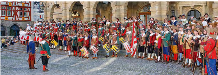
Das Historische Festspiel »Der Meistertrunk« am Marktplatz in Rothenburg

ORT: Altstadt Rothenburg ob der Tauber VERANSTALTER: Historisches Festspiel »Der Meistertrunk« e.V., www.meistertrunk.de