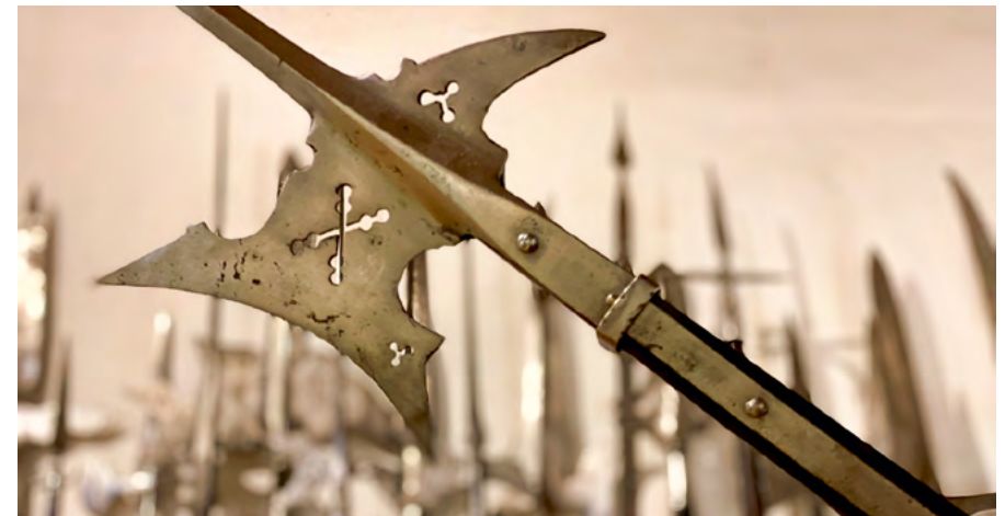
Die Hellebarde – eine typische Waffe der reichsstädtischen Zeit