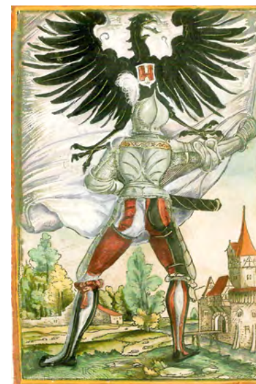
Image of Rothenburg from a armorial book from 1545

strengthened their power at the monarchy's expense. It was only after 1273 that King Rudolf von Habsburg was able to rescue those Reichsstädte whose rights were endangered by local nobility, and he successfully realigned them with the Imperial Crown. Rothenburg's high status was formally acknowledged in 1274 in a document in which its numerous privileges, licenses and freedoms were re-confirmed, enabling Rothenburg to be independent of neighboring jurisdictions. The city extended its autonomy well beyond its immediate borders throughout the region thus gaining economic power and sovereignty over a relatively large area while guaranteeing its independence for centuries to come. This long, glorious period of almost 600 years ended in 1802 when the last Reichsstädte lost their independence during Napoleon's revision of Europe's borders. By 1806, Bonaparte put an end to the Empire in its entirety. Deprived of imperial privilege, Rothenburg succumbed to history and was peacefully absorbed by the Electoral Principality of Bavaria – Baiern, or Bayern, where it remains to this day in the heart of the Middle Franconian region of the Bavarian "Freistaat". However, a large part of Rothenburg's extensive territory or "Landwehr" wound up being turned over to nearby Württemberg as Napoleon arbitrarily adjusted boundaries at will.