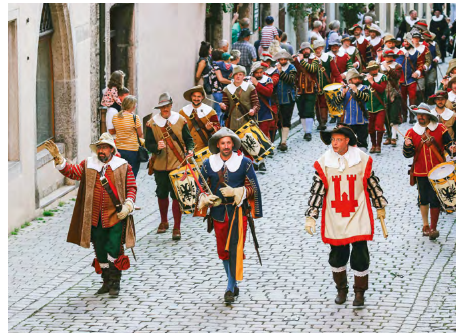
Great historical parade on Pentecost