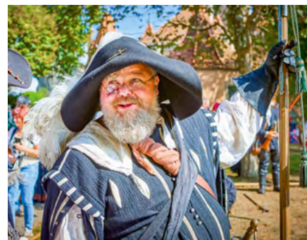
Imperial City Festival in Rothenburg

LOCATION: Market Square Rothenburg ob der Tauber ORGANIZATION BY: Stadt Rothenburg ob der Tauber, Dienststelle V "Tourismus, Kunst und Kultur", www.rothenburg.de