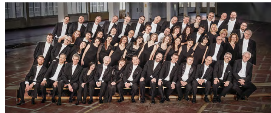
Die Nürnberger Symphoniker

ORT: Reichsstadthalle, Spitalhof 8, 91541 Rothenburg ob der Tauber VERANSTALTER: Stadt Rothenburg ob der Tauber, Dienststelle V »Tourismus, Kunst und Kultur« www.rothenburg.de